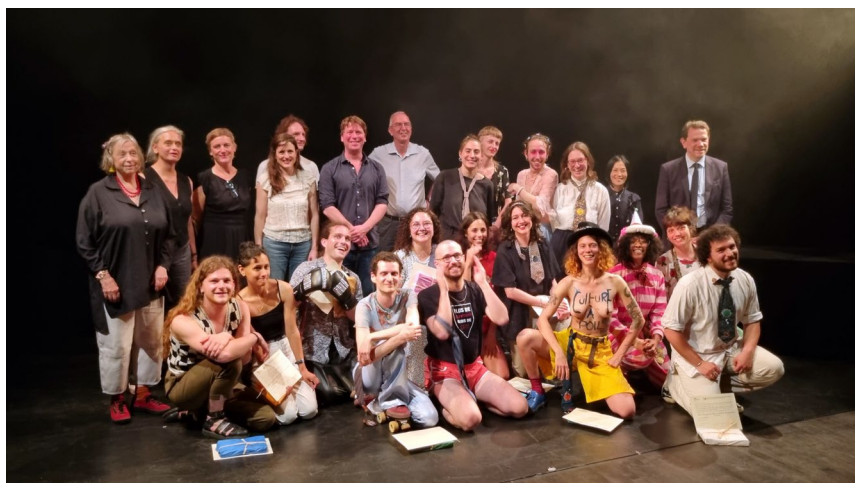
Les diplômés accompagnés du jury de diplôme, en présence du maire de Charleville-Mézières, Boris Ravignon

L'ESNAM CÉLÈBRE SES NOUVELLES ET NOUVEAUX DIPLÔMÉ·ES ET ANNONCE UNE PARTICIPATION SPÉCIALE À TEMPS D'M