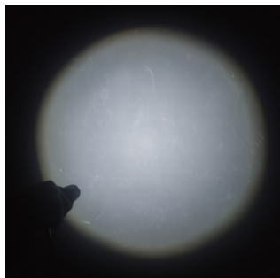
Visuel : Lucas Sivignon