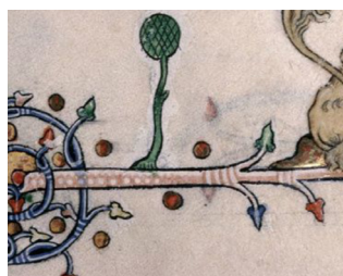
Visuel tiré des Miracles de Nostre Dame, Gautier de Coinci, début XIII e siècle.