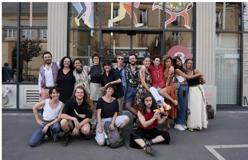
Les étudiants de la 13 e promotion de l'ESNAM - photo IIM (sept. 2023)