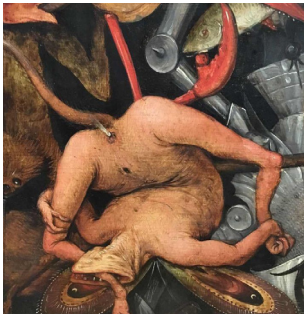
Détail d'une œuvre issue de la catégorie « La fin des Temps » de Jérôme Bosch. Fin XV e - début XVI e siècle.