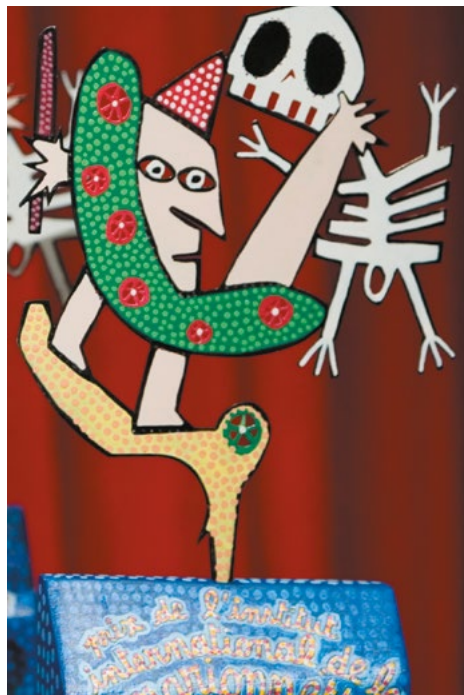
Le Püberg, trophée créé par Luc Amoros

Sur invitation - Réservation conseillée auprès de l'Institut 03 24 33 72 50 Jauge limitée