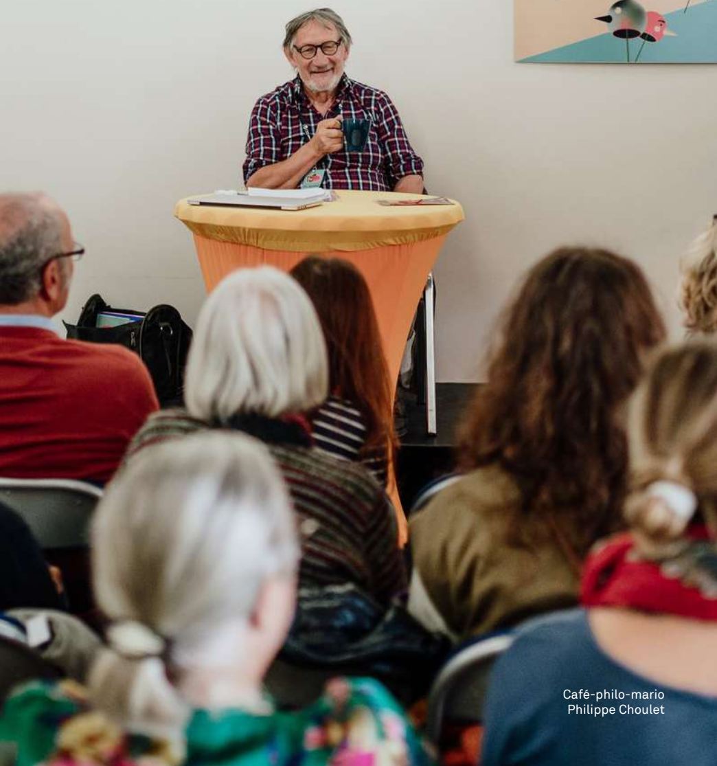
Café-philomario Philippe Choulet