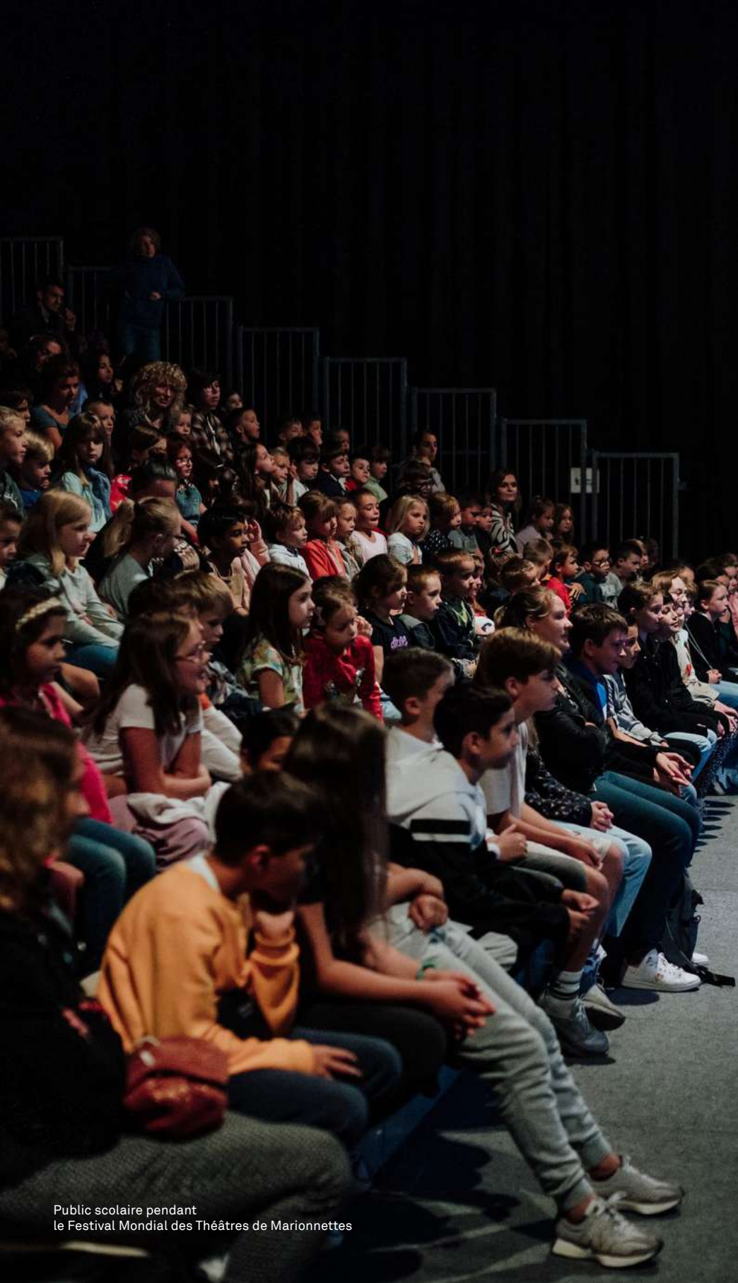
Public scolaire pendant le Festival Mondial des Théâtres de Marionnettes