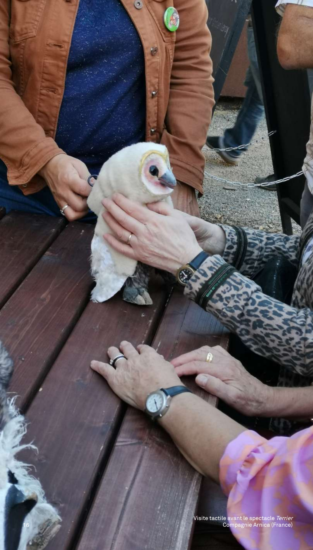
Visite tactile avant le spectacle Terrier Compagnie Arnica (France)