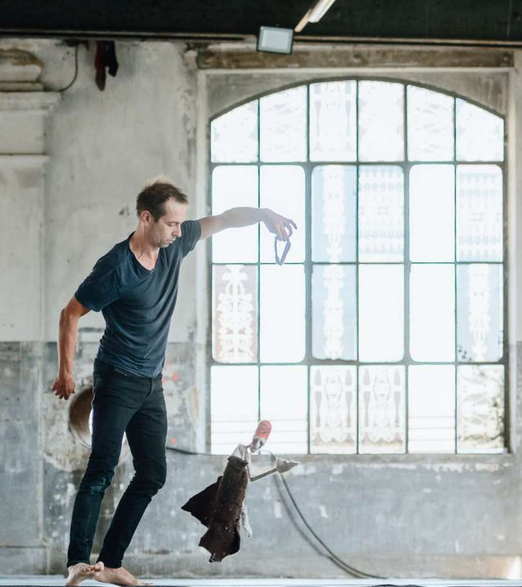
Shadow of my belonging Cie l'Étendue (France)