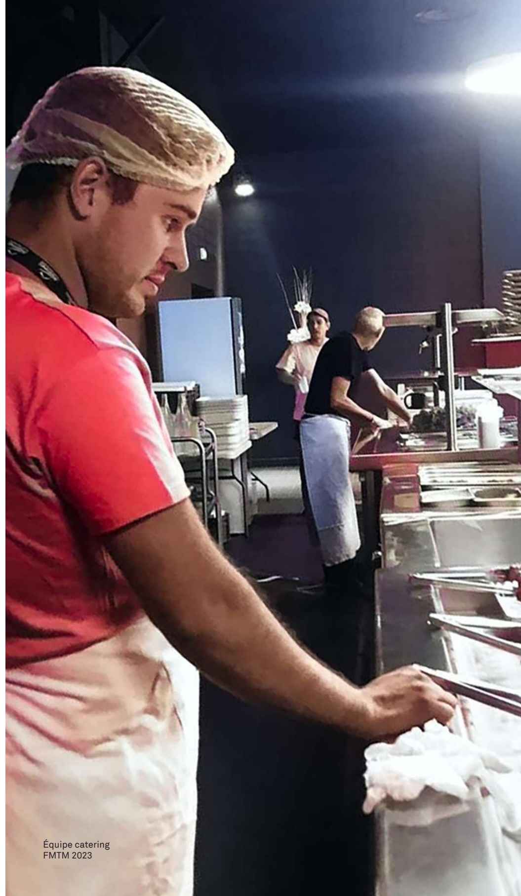
Équipe catering FMTM 2023

Le FMTM a fait le choix de travailler avec Ambition pro (atelier inclusif et responsable local) pour la réalisation des 1 720 sacs coton du FMTM.