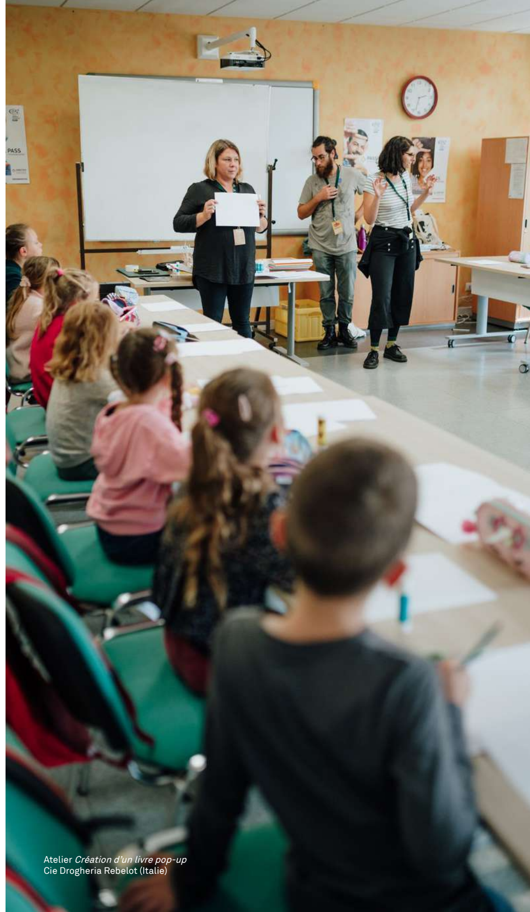
Atelier Création d'un livre pop-up Cie Drogheria Rebelot (Italie)