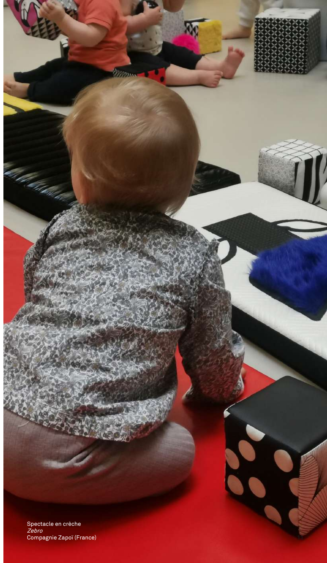
Spectacle en crèche Zebro Compagnie Zapoï (France)