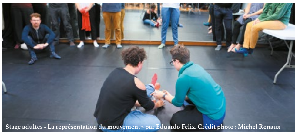
Stage adultes « La représentation du mouvement » par Eduardo Felix.