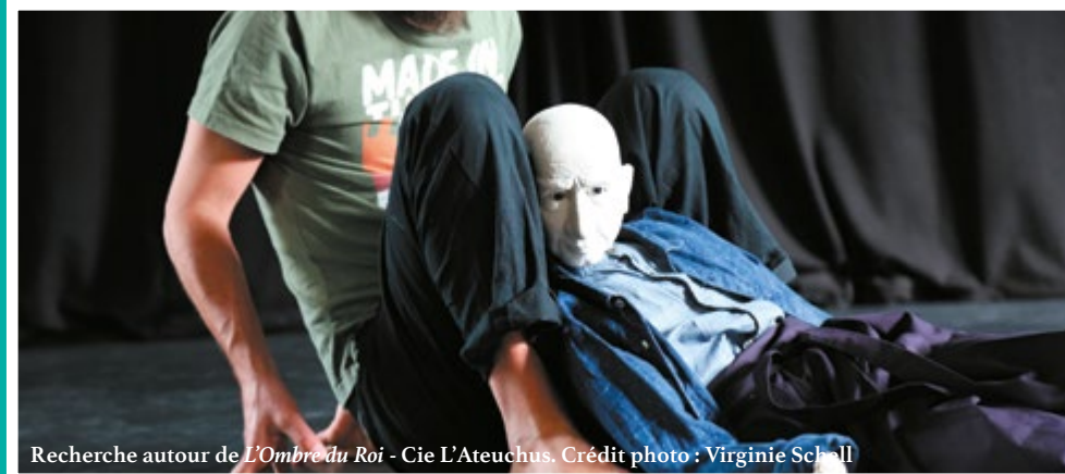
Recherche autour de L'Ombre du Roi - Cie L'Ateuchus.

Prochaines compagnies artistiques accueillies