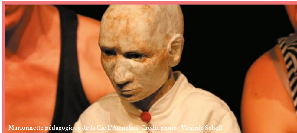
Marionnette pédagogique de la Cie L'Ateuchus.