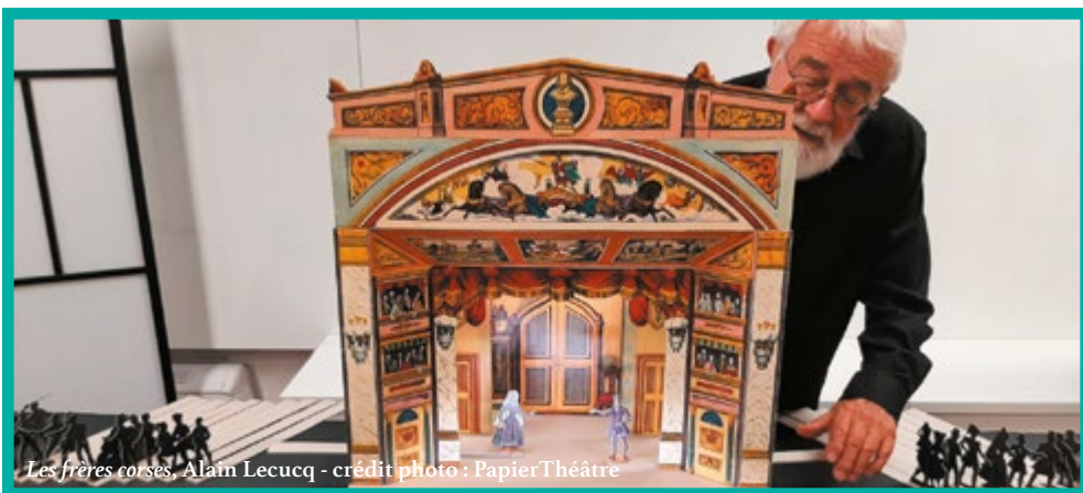
Les frères corses, Alain Lecucq - crédit photo : PapierThéâtre

M INSTITUT INTERNATIONAL DE LA MARIONNETTE