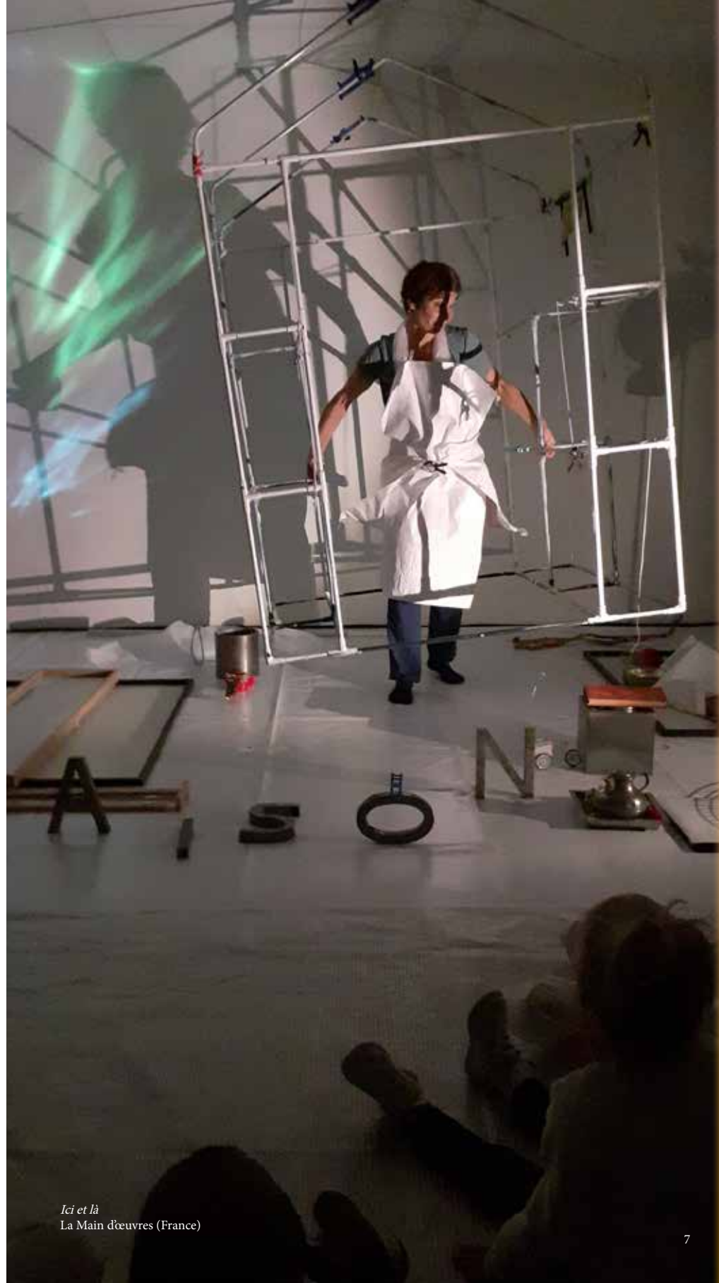
Ici et là La Main d'œuvres (France)

Soit un total de 11 « bords plateau » à l'issue des représentations.