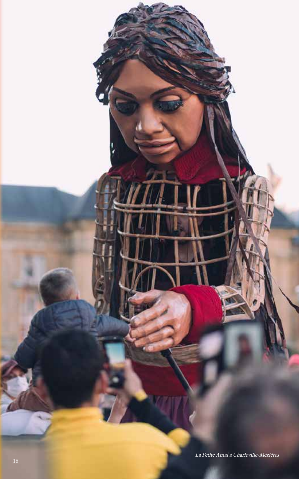
La Petite Amal à Charleville-Mézières

Avec la Compagnie des Mangeurs de Cercle et le soutien du Ministère chargé de la ville et de la Ville de Charleville-Mézières