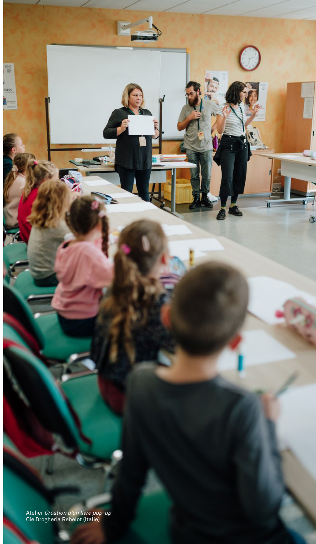
Atelier Création d'un livre pop-up Cie Drogheria Rebelot (Italie)