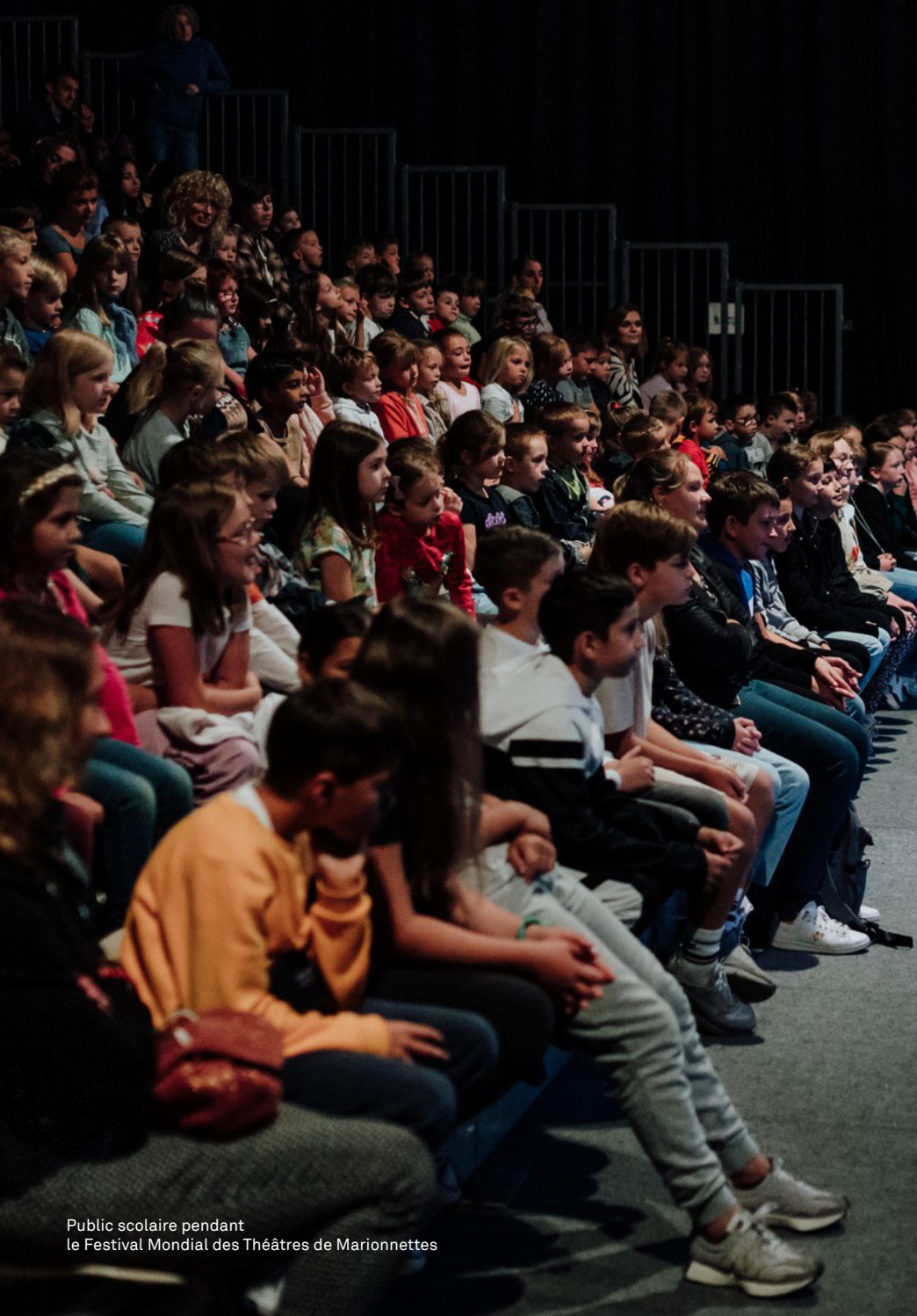
Public scolaire pendant le Festival Mondial des Théâtres de Marionnettes