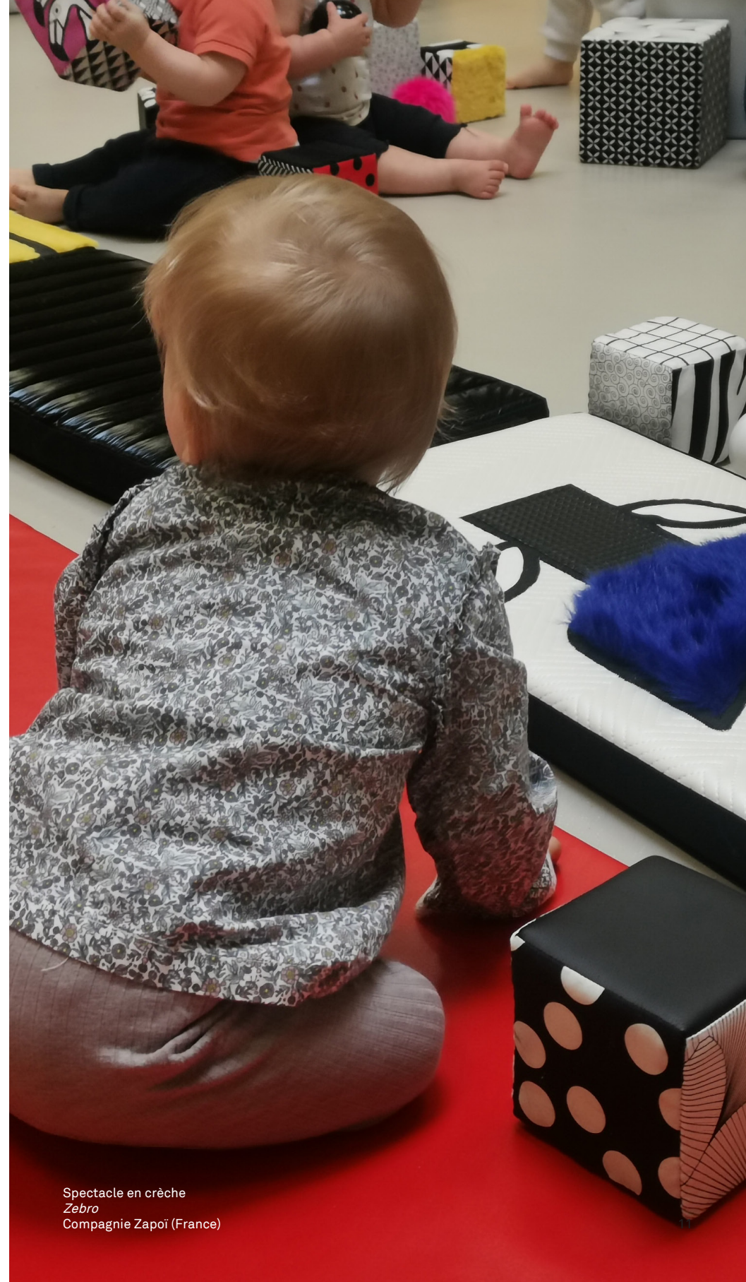
Spectacle en crèche Zebro Compagnie Zapoï (France)