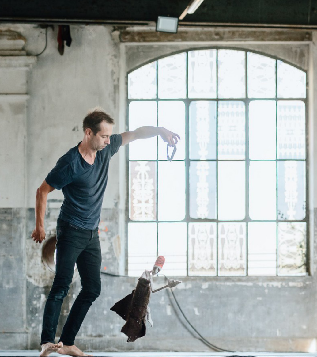
Shadow of my belonging Cie l'Étendue (France)