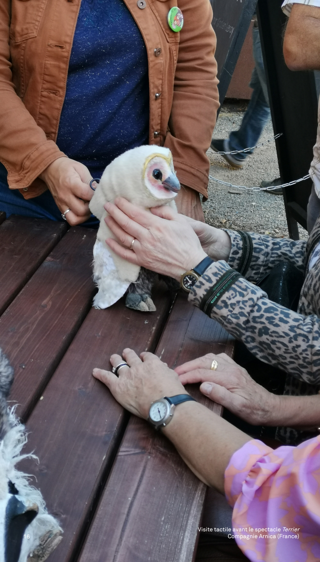
Visite tactile avant le spectacle Terrier Compagnie Arnica (France)