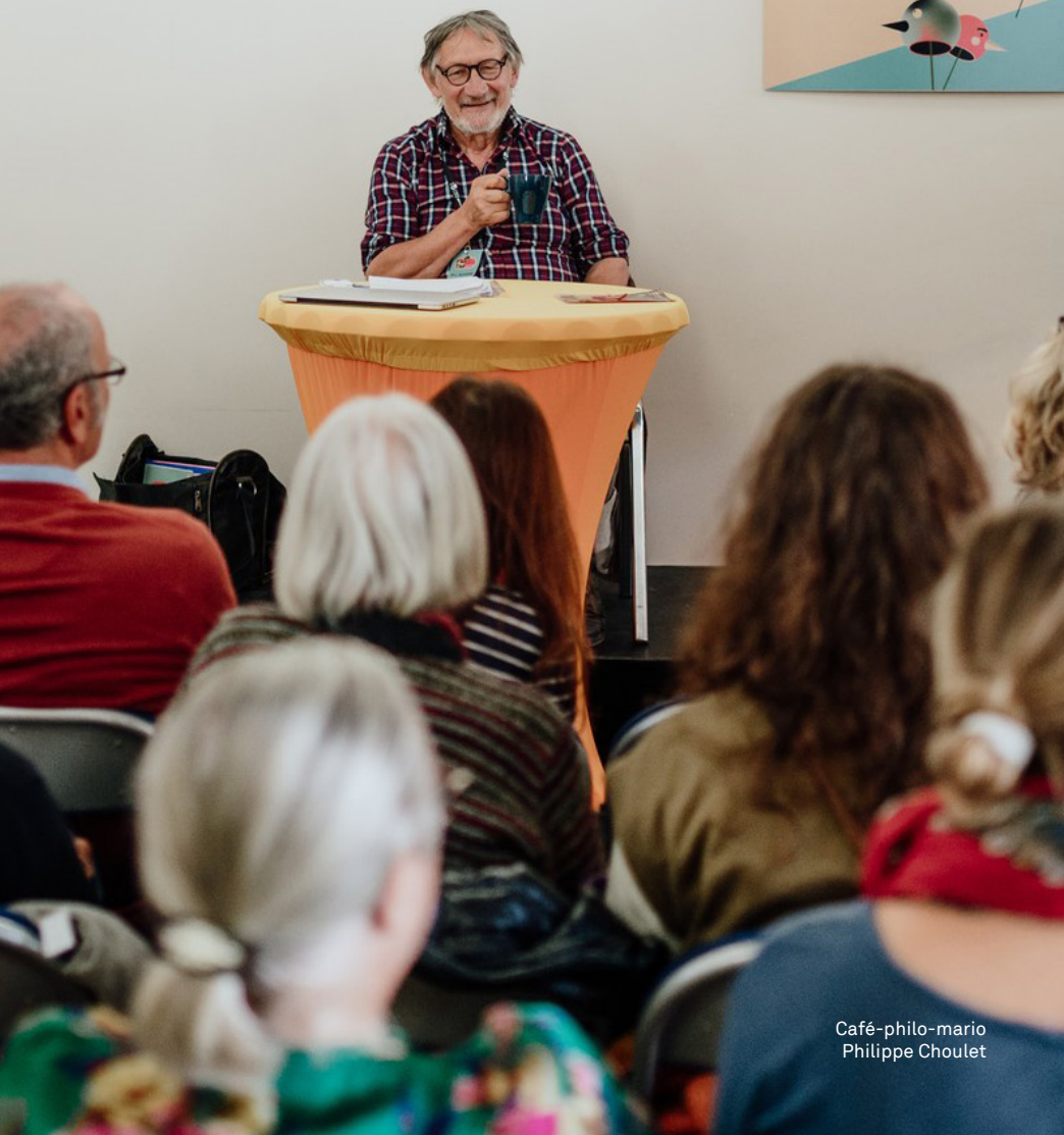
Café-philo-mario Philippe Choulet